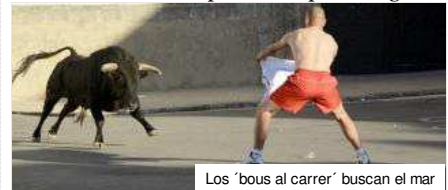
Los ‘bous al carrer’ buscan el mar

Contenido exclusivo para suscriptores digitales