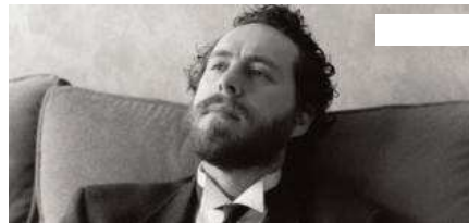
‘Si Dalí no está con Gala es por intereses’